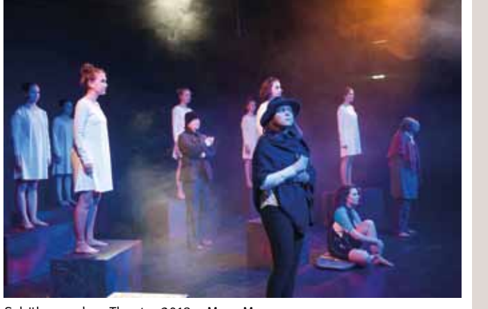
Schüler machen Theater 2018 – Mare Meum

Premiere Zwickau 7. Juni – 19.30 Uhr – Malsaal Weitere Vorstellungen 10. Juni – 18.00 Uhr – 15. Juni – 19.30 Uhr – 17. Juni – 18.00 Uhr – Malsaal