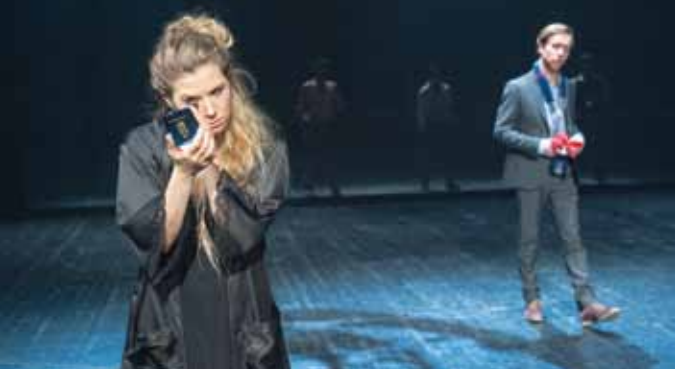
Die Räuber Schauspiel von Friedrich Schiller – ab 14 Jahren