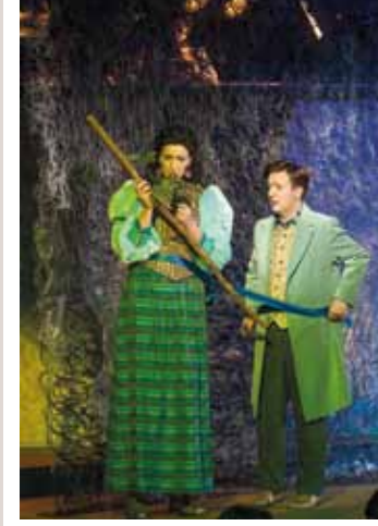
L'Orfeo Oper von Claudio Monteverdi – ab 12 Jahren