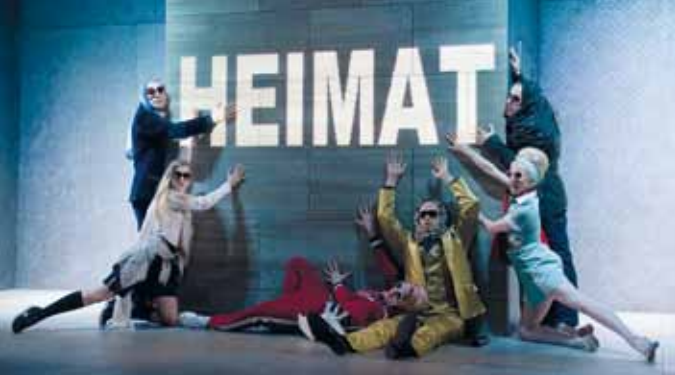
Medea Tragödie von Euripides – ab 14 Jahren