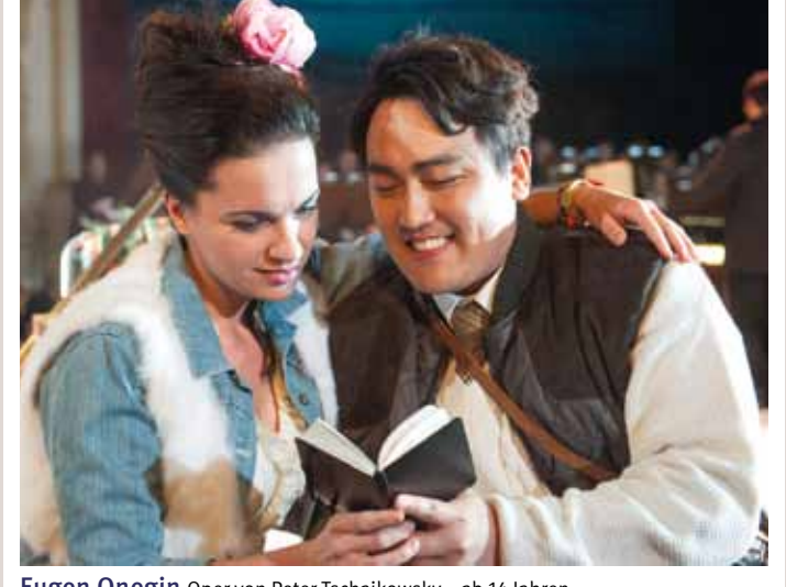
Eugen Oregin Oper von Peter Tschaikowsky – ab 14 Jahren